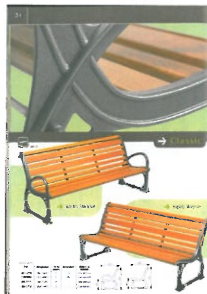
Modèle choisi par la commission